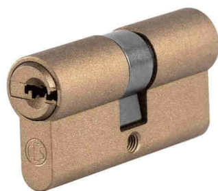
Rising Bronze C650