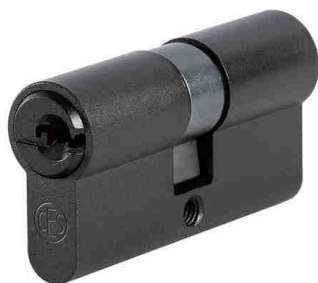
Midnight Black C690