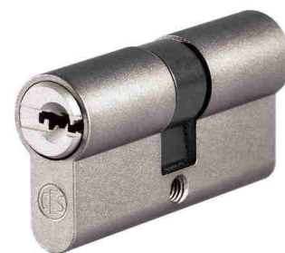
Moonlight Silver C670