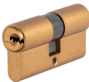
Sunset Bronze C640