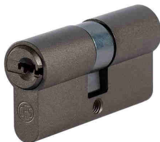
Dusk Grey C680