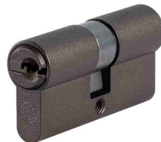
Dawn Bronze C660