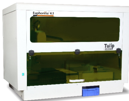
Processeur de microplaques ELISA