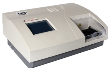
Lecteur ELISA à écran tactile