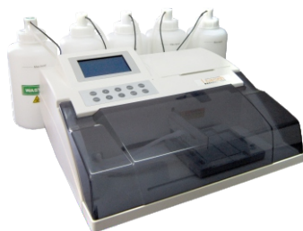
Système de Nettoyage de microplaques ELISA