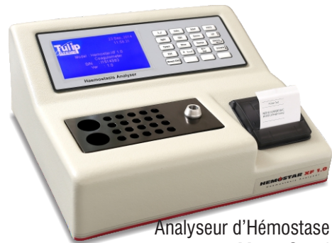
Analyseur d'Hémostase Mono-Canal