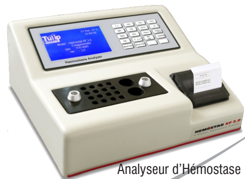
Analyseur d'Hémostase à Double Canal